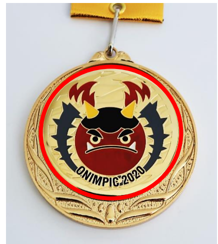
鬼んぴっく2020のメダル