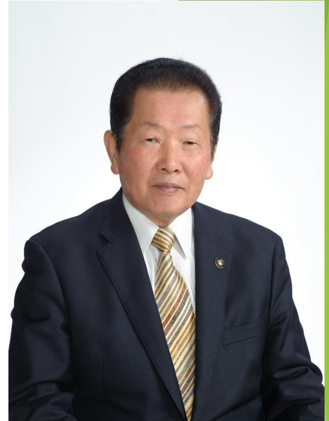
KOC (Kunisaki Onimpic Committee) chairman (Rokugo-manzan Japan-heritage council)

We would be grateful if you could participate in the Onimpic Games in order to liven up the Kunisaki Peninsula.