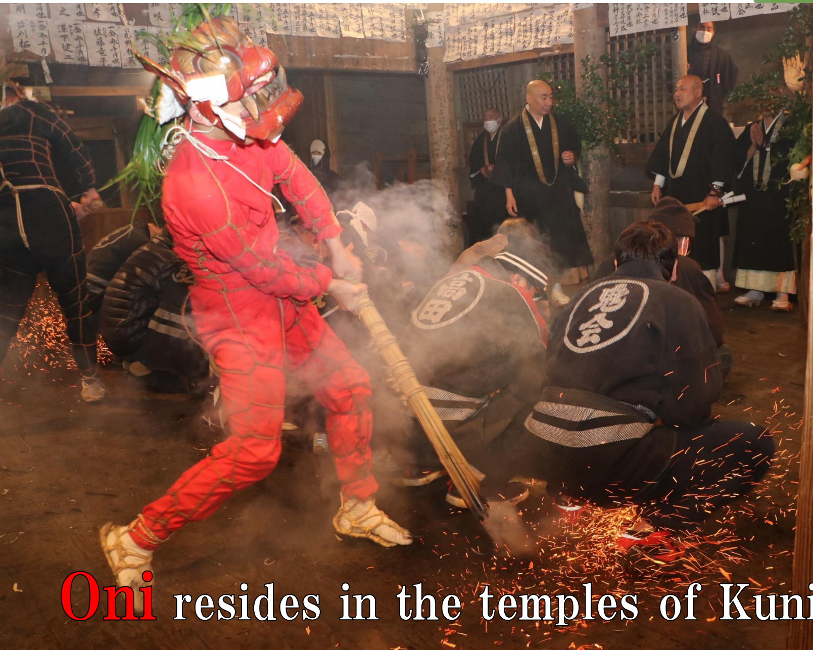
Oni resides in the temples of Kunisaki