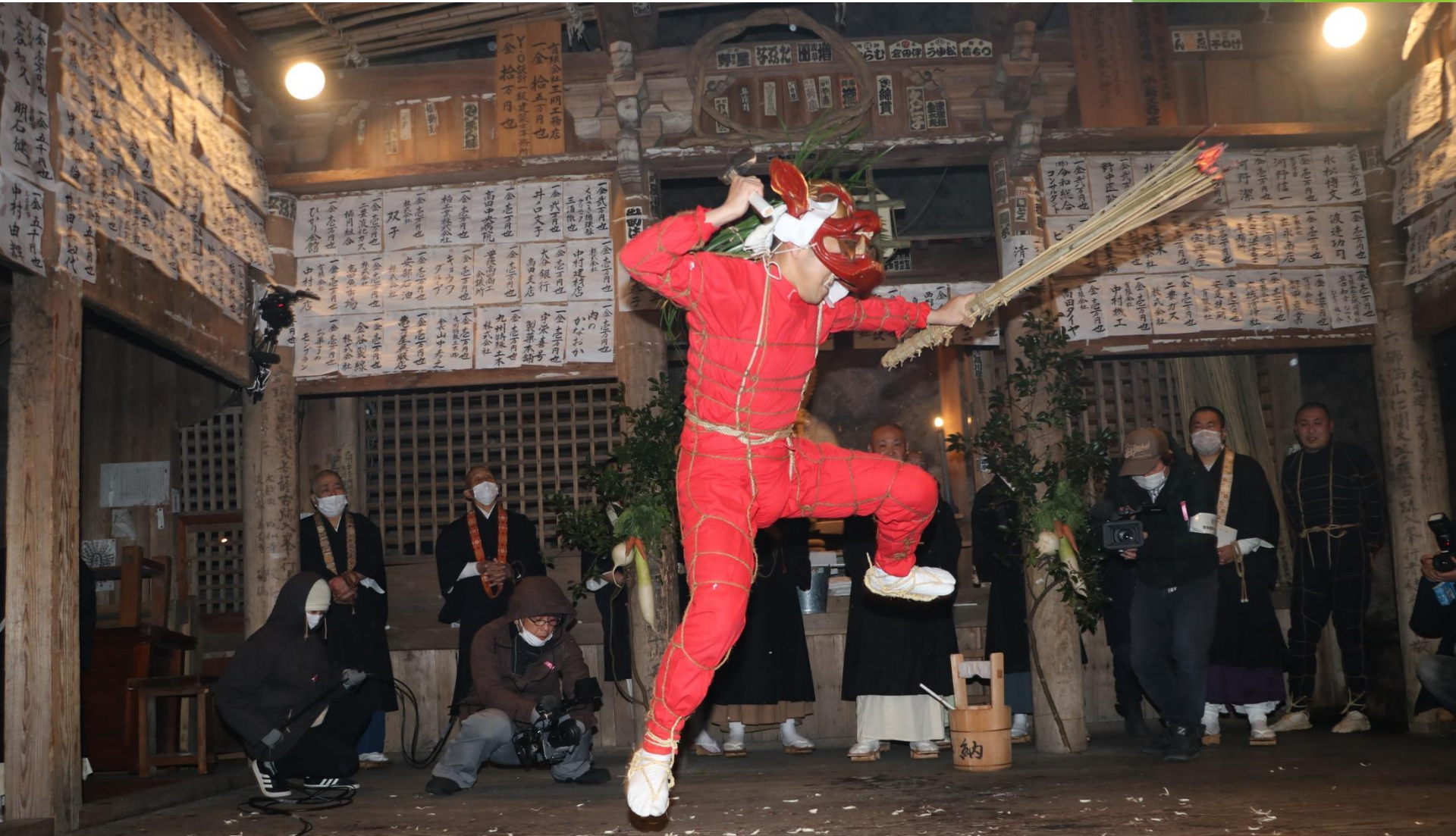
Oni resides in the temples of Kunisaki