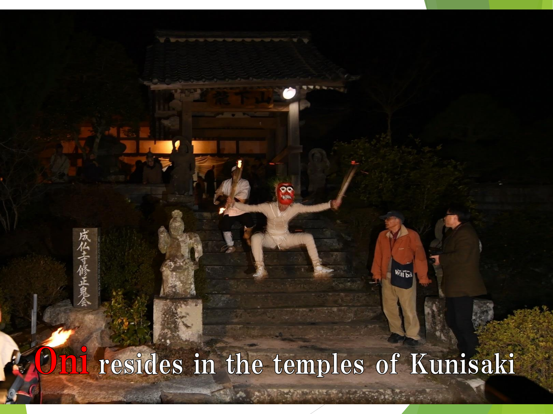
Oni resides in the temples of Kunisaki