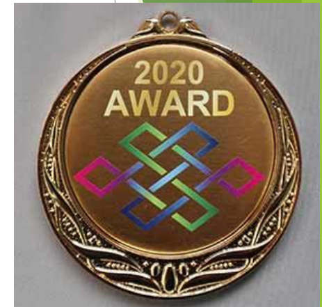
↑鬼んぴっく メダルイメージ